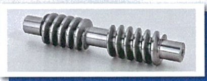
可加工雙導程蝸桿